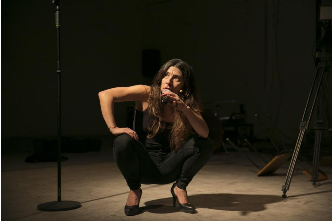
La protagonista d'Accions de resistència s'enfila als arbres per convertir-se en dona salvatge que rebutja l'estat de les coses

Les “accions” enunciades, dites i cantades per l'actriu, esdevenen un nou contracte social per reformular les normes de convivència i retornar el control de les seves vides a les persones que les ostenten. A la manera del Cosimo d'”El baró rampant” d'Italo Calvino, la protagonista d'Accions de resistència s'enfila als arbres, però no per aïllar-se de la societat, sinó per convertir-se en dona salvatge que rebutja l'estat de les coses i que construeix en aquest rebuig l'impuls revolucionari, o el seu germen, si més no.