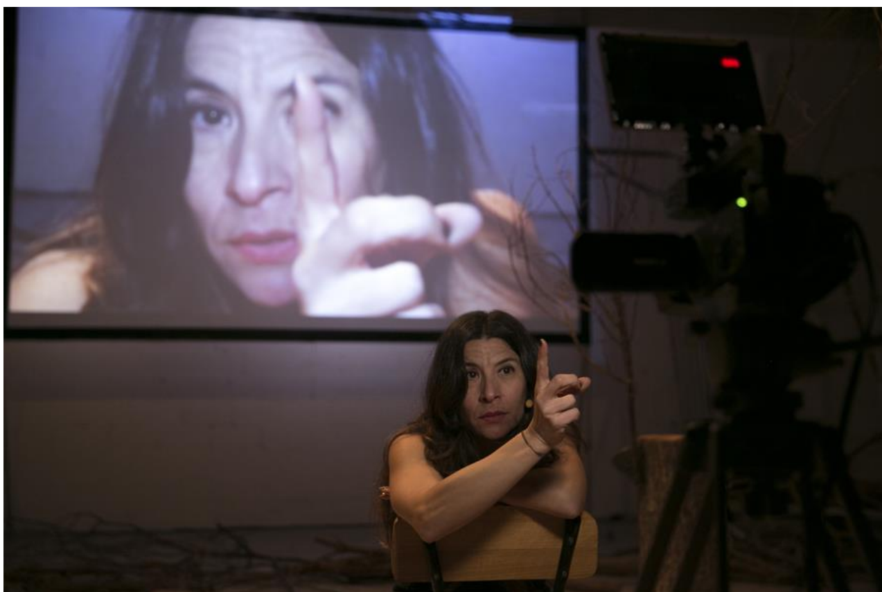
Escena de l'obra Accions de resistència a la Nau Bostik

Josep Borrell, ministre d'exteriors, en el marc d'un fòrum organitzat per la Universitat Complutense sobre el futur d'Europa, va afirmar que l'única cosa que havien fet els EUA a la seva història era "matar a cuatro indios". Un altre cop és fàcil detectar la frivolitat amb la qual el poder es refereix, en aquest cas, a un genocidi, i ens criden l'atenció dues coses: l'exabrupte prové no de la dreta tradicional, sinó de qui es postula des del final de la dictadura com a paladí de la lluita progressista; a més, el ministre esventa l'ocurrència enmig d'una discussió sobre la idea d'Europa.